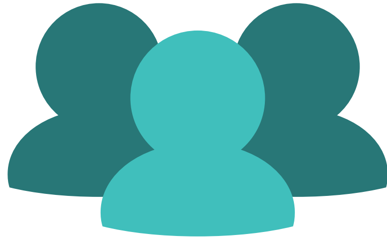
Figure dei territori introducono la giornata, esemplificando il nuovo metodo con una breve descrizione di sperimentazioni/casi, dei loro ostacoli, errori, insuccessi e successi, sottolineando soprattutto i processi di apprendimento (se esistenti).